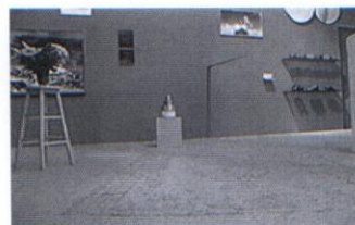
Tapis Dessin au sirop. dimensions variables, 2004