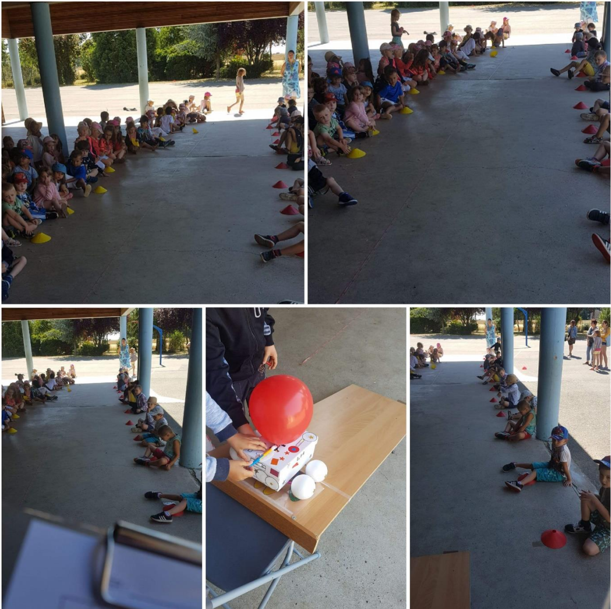
Lieu de la finale Ecole Arc-en-ciel de Baudreville