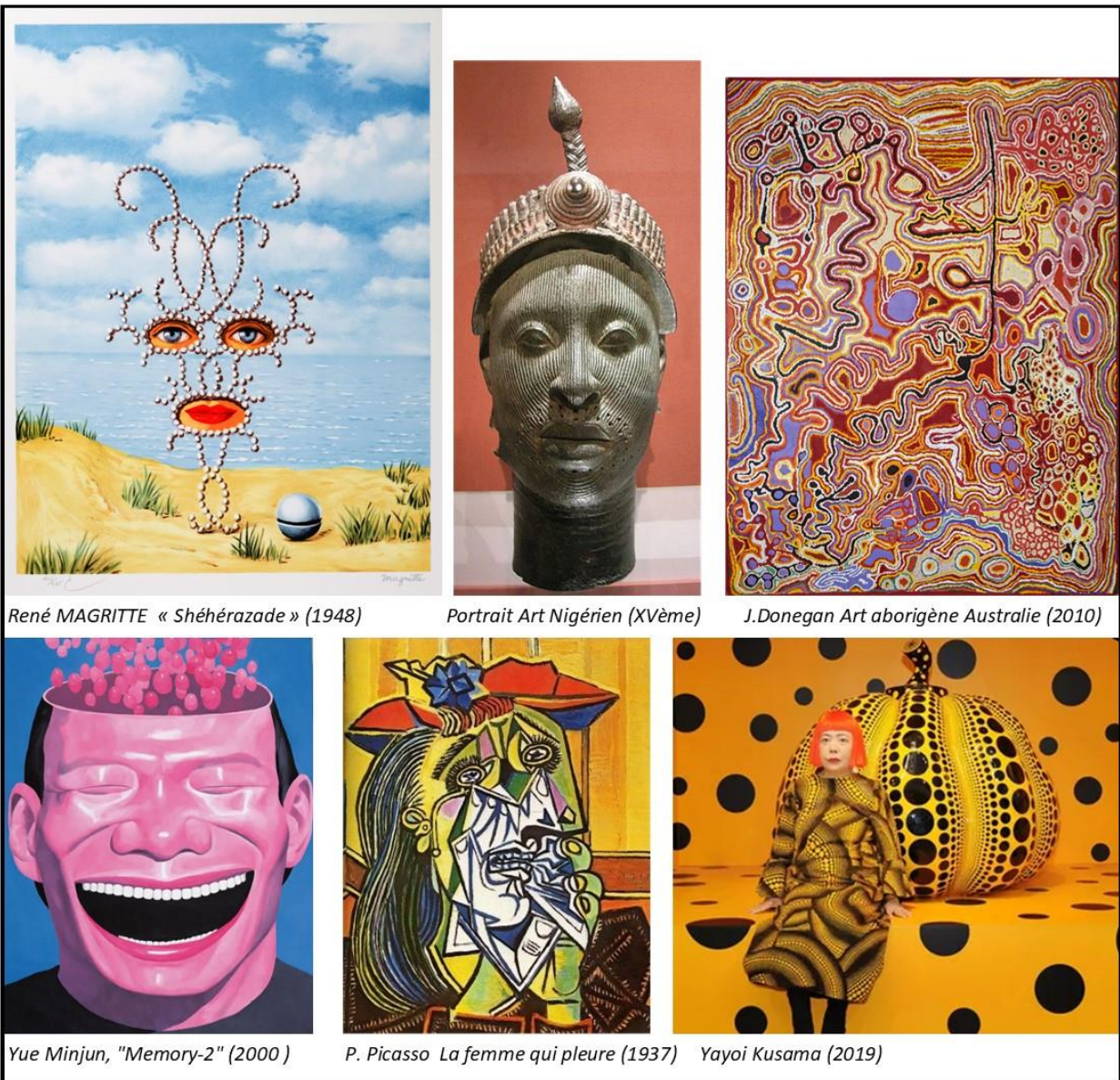
René MAGRITTE « Shéhérazade » (1948)