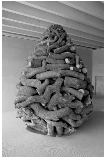
Cairns d'Andy Goldsworthy