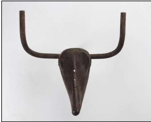
Tête de taureau Picasso Pablo (1881-1973)

(Ctrl+clic sur les images pour les agrandir)