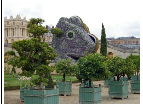
Jeff Koons « Split Rocker » 2008 Sculpture végétale