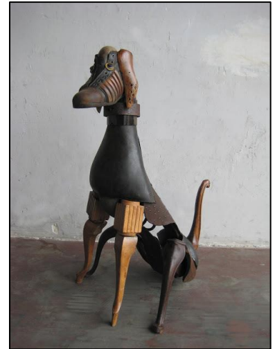
Shoe-schoe dog Miquel Aparici