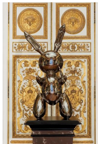
Jeff Koons « Rabbit » 1986 Acier inoxydable