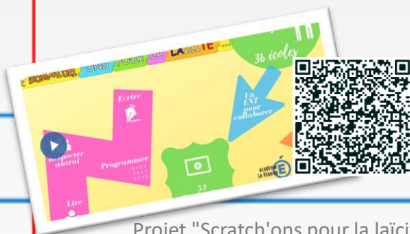
Projet "Scratch'ons pour la laïcité..." -Académie de la Réunion-