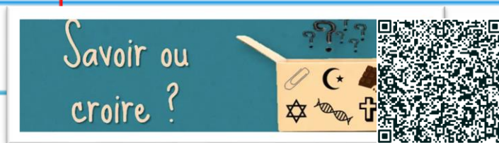
Un exemple de projet autour de L'éducation à la laïcité - Reims-